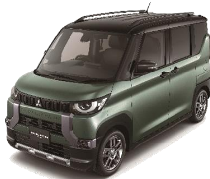
DELICA MINI Photo：T Premium アッシュグリーンメタリック/ブラックマイカ（有料色） ●写真は4WD